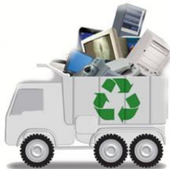
COLETA DE SUCATAS DE FERRO E AÇO