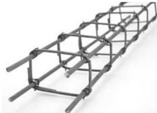
COLUNAS E VIGAS